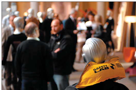
Cortile d'Onore, esposizione Well-Tech Award 2008.