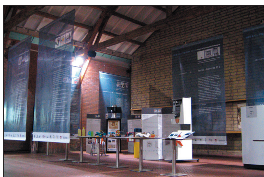
Well-Tech Award presso Città della Scienza di Napoli