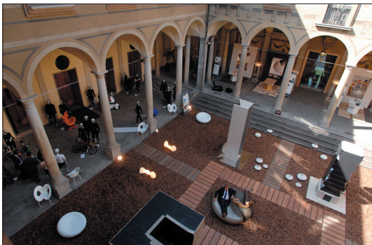
Palazzo Isimbardi, Cortile d'Onore. Progetto espositivo WT Village 2008