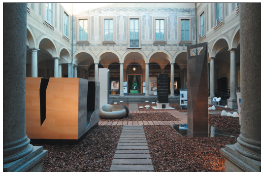
Palazzo Isimbardi, Cortile d'Onore. Progetto espositivo WT Village 2008